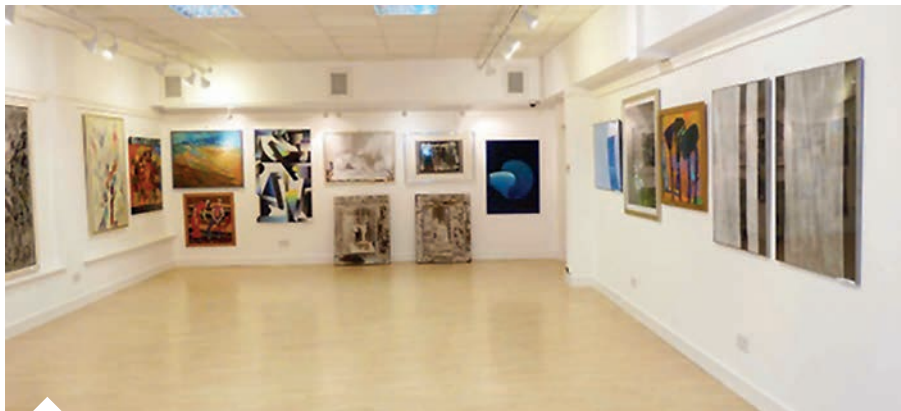
GTPS, Gdańsk - wystawa malarstwa.