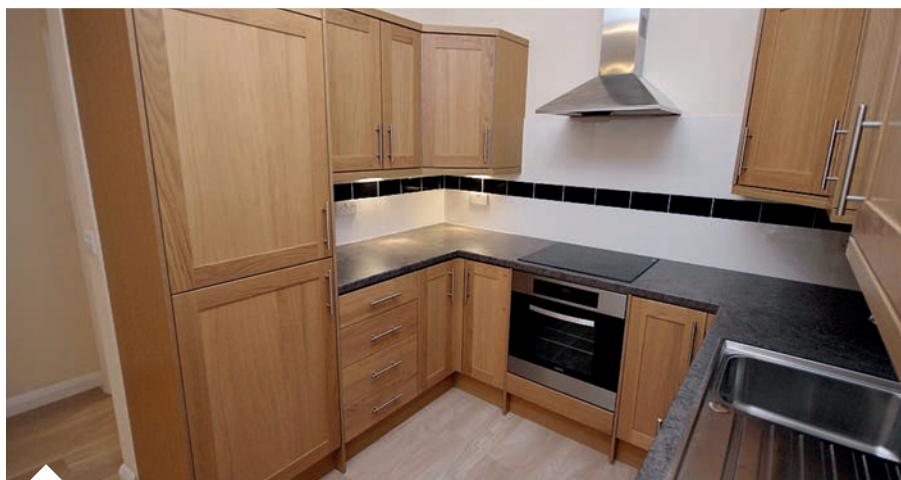
4 luksusowe mieszkania we wschodnim skrzydle POSK-u.

Czas nagle aby ten drugi projekt rozpocząć, ale przy takiej współpracy – na którą nie mamy wpływu – termin rozpoczęcia się przedłuży.