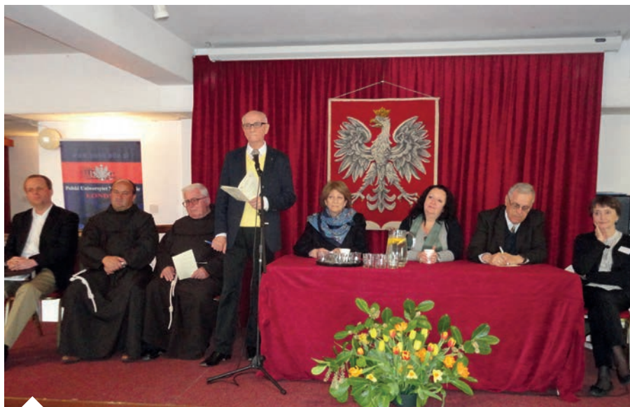
Prelegenci Konferencji Kwietniowej PUNO 12-13.04.2014

wadził Zakład Psychologii Stosowanej PUNO. Rozpoczęto kolejną edycję studiów z zakresu Seksuologii Społecznej oraz nowe studia na kierunku Coaching.