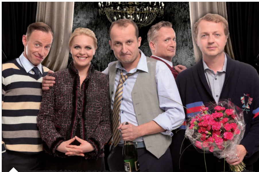
„Kabaret Moralnego Niepokoju” w najnowszym rewelacyjnym programie.