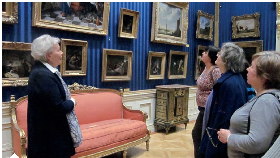
Zajęcia Uniwersytetu Trzeciego Wieku PUNO w Wallace Coll