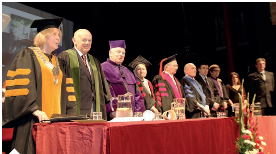
Jubileusz 75-lecia PUNO i Inauguracja roku akademickiego