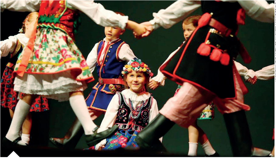
Spektakl "Kolorowy Folklor"

Sytuacja finansowa POSKu poprawia się z roku na rok, jak widać ze szczegółowego sprawozdania Skarbnika. Niezbędne jest jednak skrupulatne czuwanie nad zarówno większymi i mniejszymi wydatkami i przychodami POSKu, jest to odpowiedzialnością wszystkich pracowników POSKu zarówno płatnych jak i wolontariuszy. Nowy system komputerowy księgowości wprowadzony w 2014 roku pomaga nam w tym ważnym aspekcie. Rozwijamy nowe źródła dochodów ale również pilnujemy aby wydatki dawały nam jak najlepszy zysk.