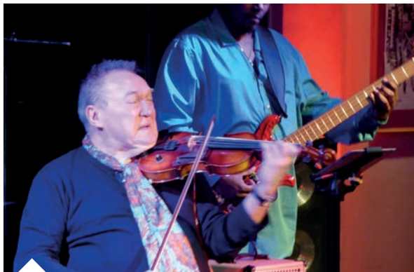
Michał Urbaniak 22.11.14 (London Jazz Festival)

gramu do wielokulturowej społeczności Londynu, poprzez włączenie do naszych propozycji repertuarowych artystów brytyjskich, europejskich i światowych. Przyciągnęliśmy w ten sposób międzynarodową publiczność i dzisiaj w naszym klubie można usłyszeć obok języka polskiego wiele języków wschodnio i zachodnioeuropejskich. Największym naszym sukcesem jest