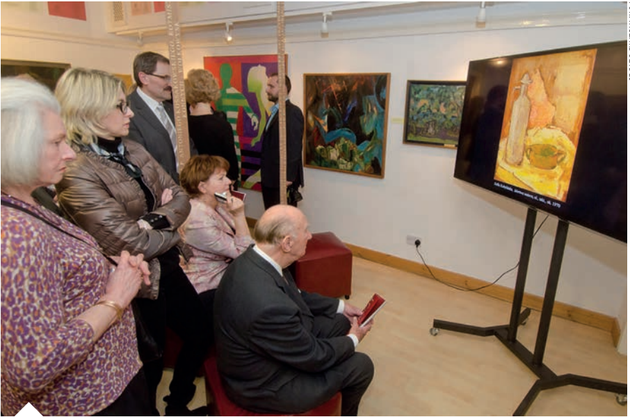
Goście na wystawie inauguracyjnej oglądają na ekranie całość Malarstwa Współczesnego