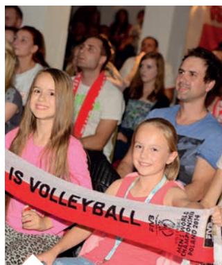
Do klubu oprócz seniorów zaczęła płynąć szeroką falą młodzież.

Staramy się, żeby POSKlub był miejscem, w którym odnajdą się wszyscy jego bywalcy. Był to i jest cały czas