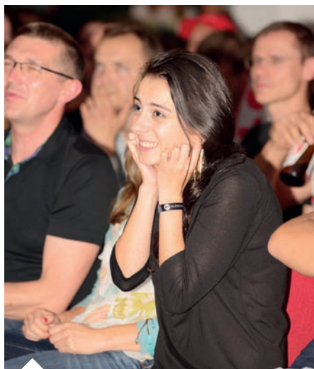
Każdy może znaleźć u nas swoje miejsce.

klub towarzyski, który kontynuuje swoje wieloletnie tradycje. Nie dzielimy ludzi na gorszych i lepszych, każdy może znaleźć u nas swoje miejsce.