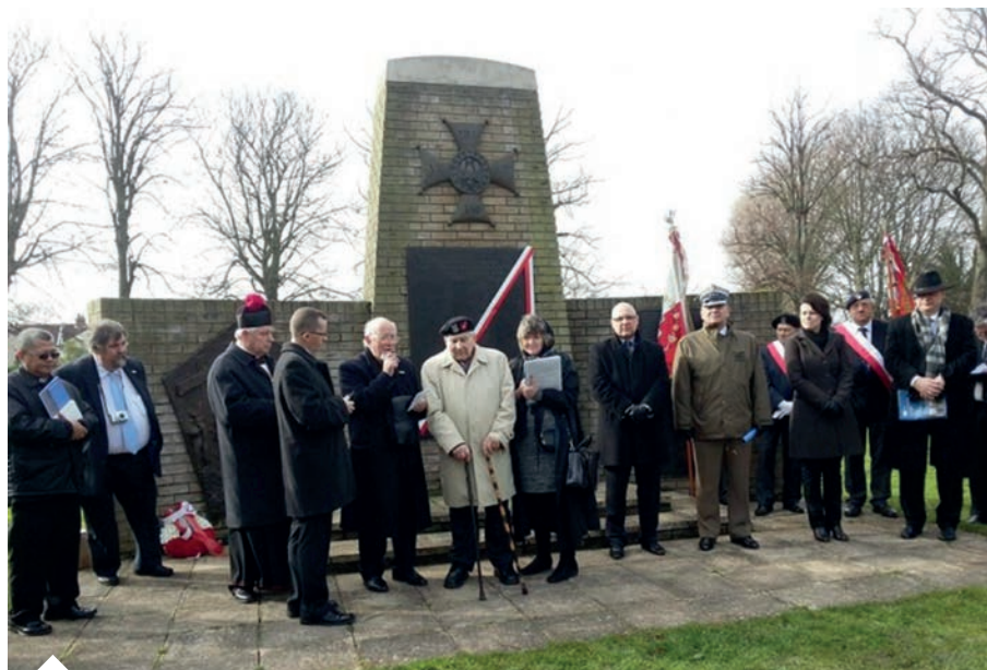
Przy pomniku w Portsmouth, luty 2014