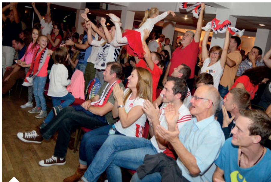
Mistrzostwa Świata w Piłce Siatkowej w Sali Malinowej organizowane przez POSKlub

Szkoła Tańca U PIOTRA w Londynie Tel 07540473454 także www.naukatanca.co.uk