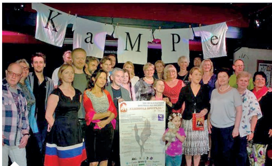
“Zaklinanie lata” - 15.06.2014 - spotkanie z poezją i muzyką, organizowane przez KaMPe