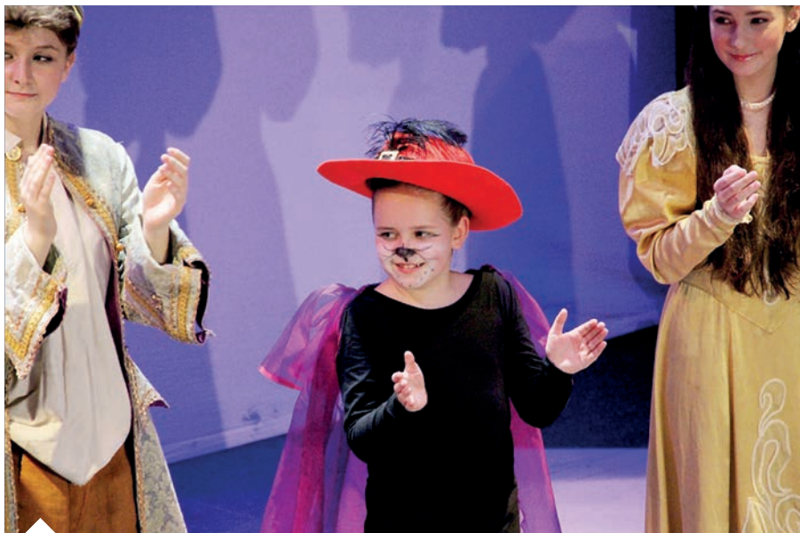
„Kot w Butach” Hanny Januszewskiej

W roku jubileuszowym Teatru Syrena wystawiliśmy bajkę Hanny Januszewskiej „Kot w Butach”. Ostatni raz sztuka ta była wystawiona dokładnie 55 lat temu.