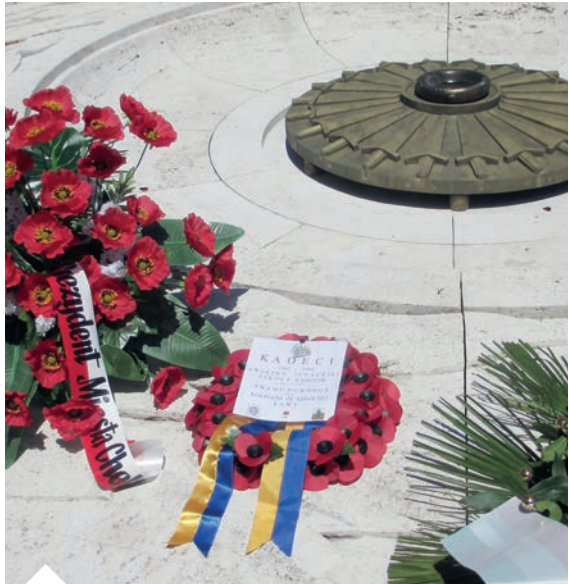
Złożenie wieńca kadeckiego na Monte Cassino 18go maja 2014 r.

Wielu padło walecznie w kampanii włoskiej, wielu też zdobyło wysokie odznaczenia bojowe. Po przeniesieniu Junackiej Szkoły Kadetów do Anglii (Bodney) w sierpniu 1947 r. - po ostatnich egzaminach maturalnych życie szkoły kończy się 28 lutego 1948 r. Młodszych wiekiem kadetów (gimnazjalistów), którzy pozostali w Wielkiej Brytanii umieszczono w różnych internatowych polskich szkołach cywilnych (Riddlesworth, oraz kurs maturalny w Haydon Park) pod opieką Komitetu dla spraw oświaty Polaków w Wielkiej Brytanii. Duża grupa wstąpiła do armii brytyjskiej, oraz do R.A.F.'u. Wielu kolegów rozjechało się po świecie.