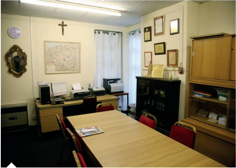
Nowe biuro Zjednoczenia Polek

sze Polskiej Fundacji Kulturalnej i Polskiej Macierzy Szkolnej. Zgodnie z umową czynsz Instytutu J. Piłsudskiego wzrósł znacząco, ale w dalszym ciągu jest bardzo niski. Tym niemniej doceniamy to że Instytut nie ma stałego źródła dochodu i płaci tyle ile może. Ważne że ma piękne muzeum i może się rozwijać.