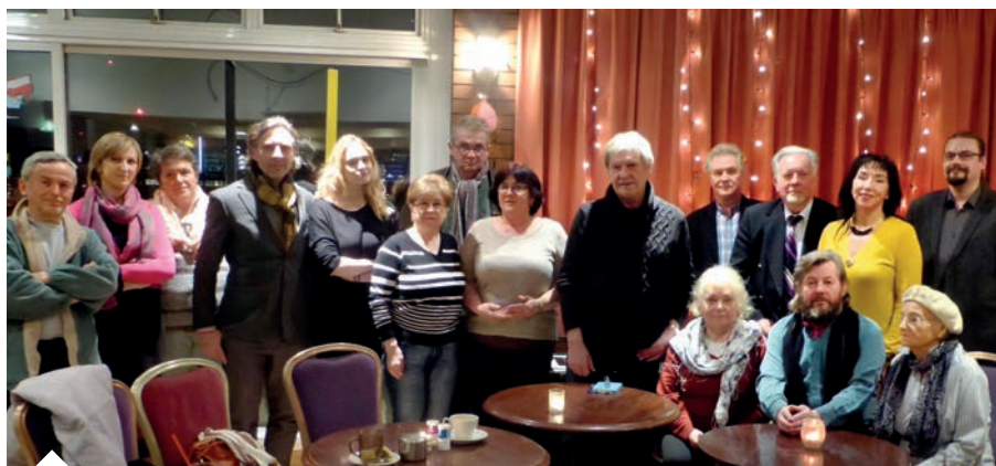
Wieczór Twórczości Wszelakiej

Oczywiście starzy bywalcy też znajdują u nas to, co cenią najbardziej – spokój i spotkania ze znajomymi. Prężnie działa Grupa Seniorów, do której cały czas zapraszamy