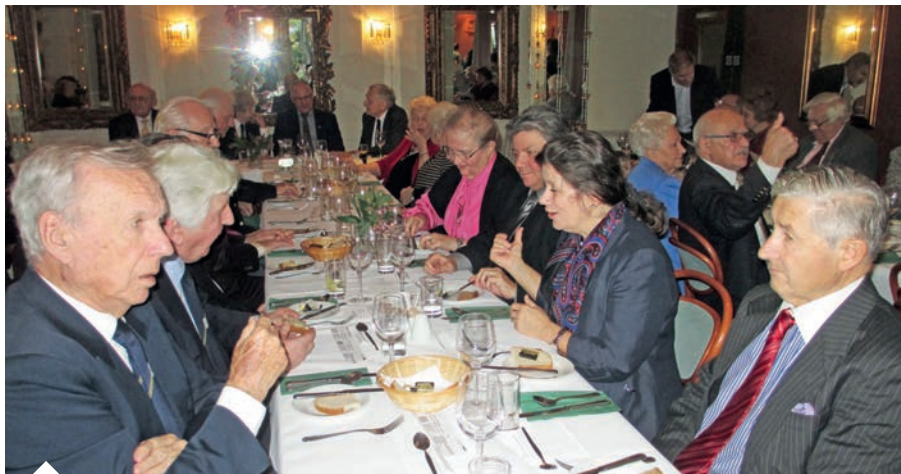
Obiad koleżeński 30.11.2014 w POSKu (ponad 40 osób).

Pamięć wojennych, wspólnie przeżytych lat młodości, związała mocno kolegów z Junackiej Szkoły Kadetów – gdziekolwiek by się znajdowali - w Londynie czy Manchesterze, w czarnej Afryce, Nowej Zelandii czy Buenos Aires, w Chicago czy Montrealu. Pielegnowaniem tej więzi - przede wszystkim zajmuje się obecnie Związek JSK, założony po wojnie, pod koniec lat czterdziestych (oryginalnie jako koło JSK).