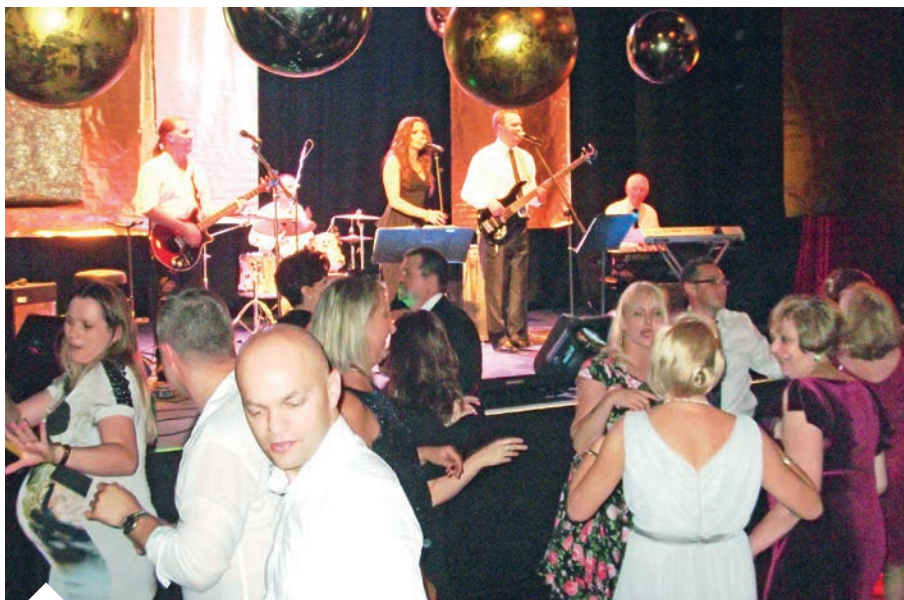
Uroczysty bal zorganizowany z okazji 50. rocznicy powstania POSK-u przy muzyce zespołu "Czaban Band"