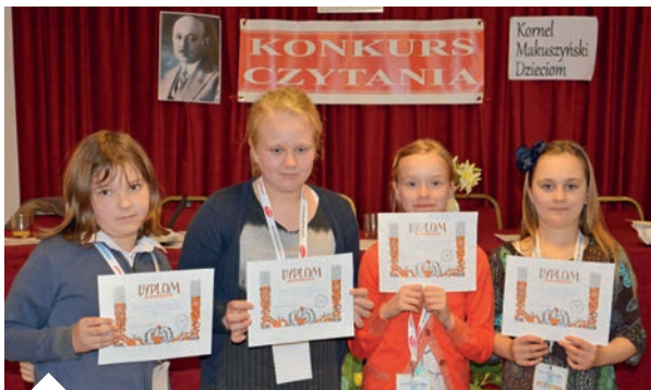
Laureaci Konkursu Czytania - uczniowie z Polskiej Szkoły Przedmiotów Ojczystych im. Heleny Modrzejewskiej w Londynie na Hanwell