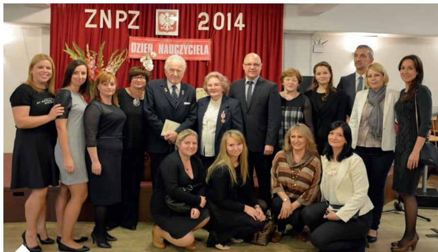
Dzień Nauczyciela zorganizowany przez ZNPZ. Na zdjęciu prezes ZNPZ, uczestnicy spotkania, goście, pracownicy konsulatu oraz dyrektorzy i nauczyciele szkół uzupełniających