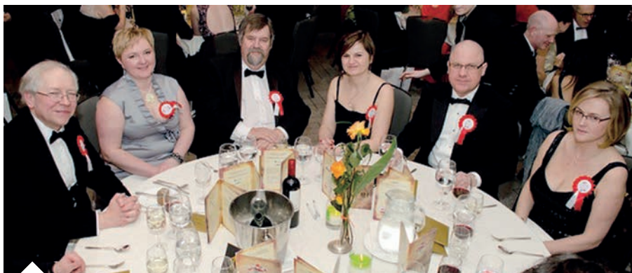
Na Balu Polskim w styczniu 2014