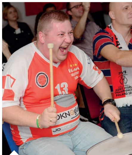
Emocji nie brakowało...