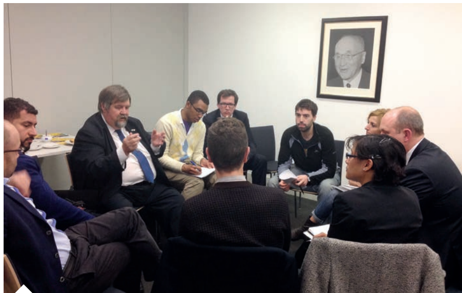
Spotkanie z organizacją New European w Europa House, luty 2014