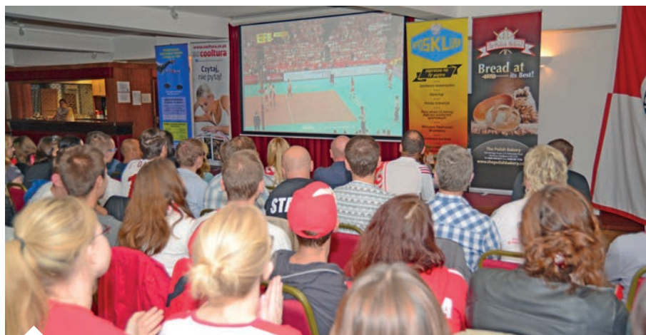
Mistrzostwa Świata w Piłce Siatkowej w sali Malinowej