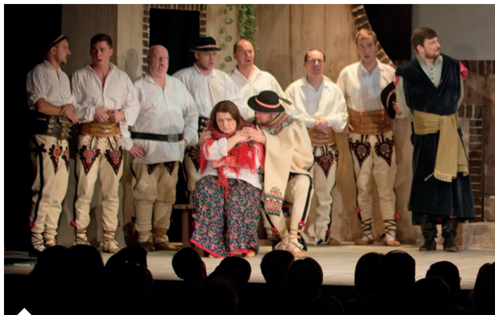
„Halka” – opera Stanisława Moniuszki

Na zakończenie Roku Jubileuszowego kulminacyjnym wydarzeniem był uroczysty Oplątek w pięknie udekorowanej Sali Teatralnej na który zostali zaproszeni wszyscy członkowie POSKu. Do świątecznej atmosfery przyczynił się występ Chóru Ave Verum ze specjalnym programem.