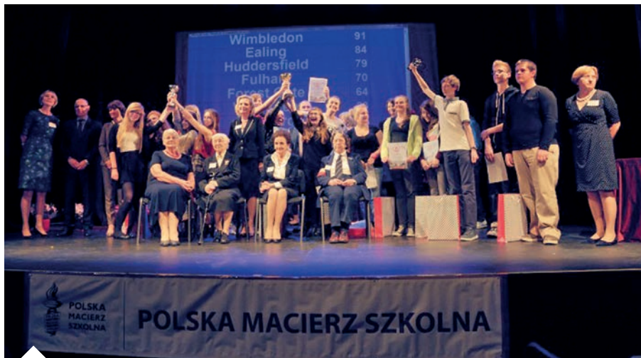
Międzyszkolny Konkurs Wiedzy Historycznej