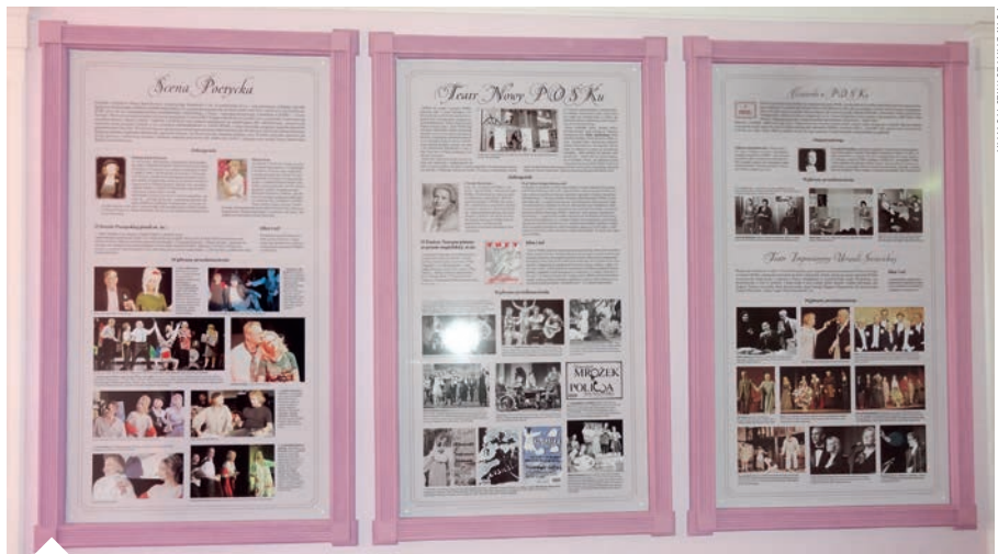
Stała wystawa pt. "Działalność Teatralna POSK-u" w foyer Teatru.