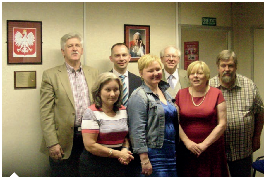
Prezydium ZP w biurze w październiku 2014

Dla usprawnienia pracy w biurze ZP zaplanowano zainstalowanie nowej sieci komputerowej, z nowymi komputerami, które umożliwią wprowadzenie Zjednoczenia na nowy poziom działania. Planuje się również wznowienie Informatora Polskiego choć specyficjnie na naszej stronie internetowej, z wersją drukowaną w mniejszym nakładzie, dla zaoszczędzenia kosztów.