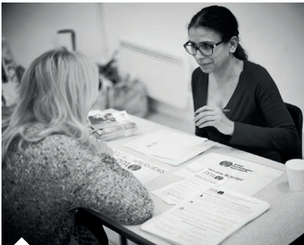
Wolontariusz Biura Karier prowadzi konsultacje

Z przyjemnością podtrzymujemy współpracę