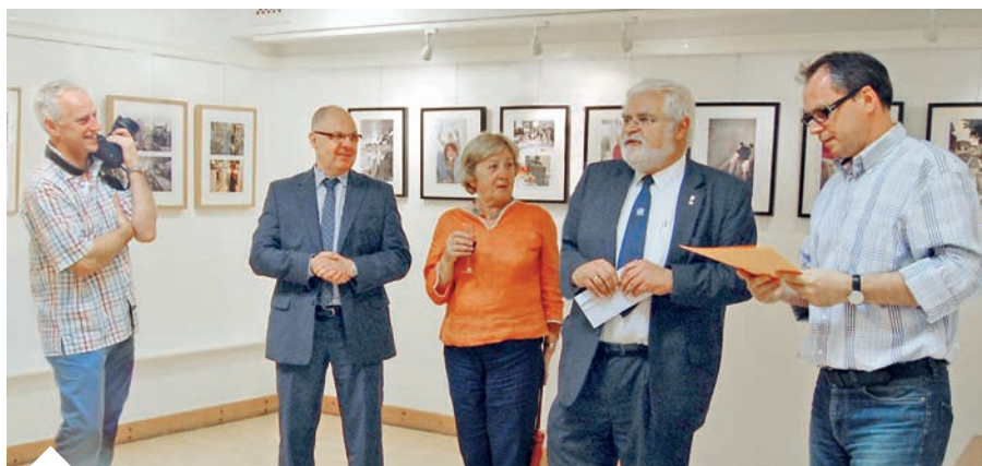
Otwarcie wystawy prac laureatów Konkursu Fotograficznego im. Tadeusza Murdzeńskiego zorganizowanego przez Polską Fundację Kulturalną przy współpracy z POSK.