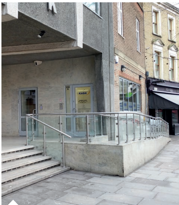
Front budynku z wejściem do nowych mieszkań oraz nowe biuro "Kasy"

Zwracamy się do wszystkich członków z prośbą o zawiadamianie biura POSK-u w wypadku zmiany adresu.