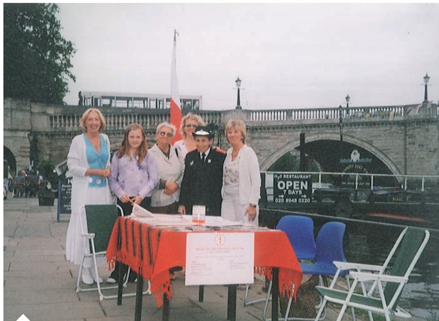
Rejs po Tamizie, akcja charytatywna MAPF